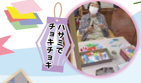
ハサミでチョコチョコキ