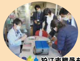
狛江市職員も立ち合いました

(令和3年4月1日～7月31日) 承諾をいただいた個人の方のみ氏名を掲載させていただきます。