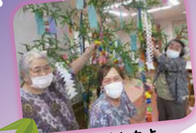
きれいに飾れたよ