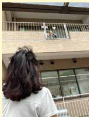
▲ベランダ面会の様子