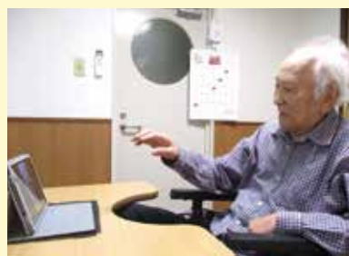
▲オンライン面会の様子

当施設では、新型コロナウイルス感染症予防対策として全職員に勤務前の検温や手洗いうがいの徹底、会議や職員食堂では三密を避けプライベートでも感染するような行動の自粛、ご家族様の面会制限等の対策を実施しています。そんな状況下ですが、駐輪場と2階ベランダ越しからの面会やオンラインによる面会を実施しています。ご不便をおかけしますがご理解の程よろしくお願いたします。