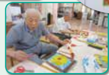
柿の実が なりました！