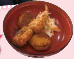
大きなエビフライ!