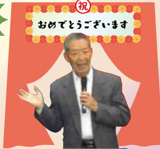
祝 おめでとうございます