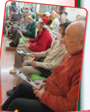
トーンチャイムを使って