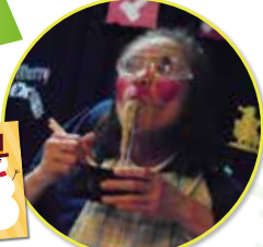
二人羽織で頑張りました!