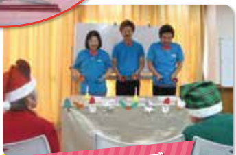
髭トリオのハンディベル演奏♪