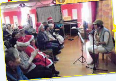
寅さんの弾き語り