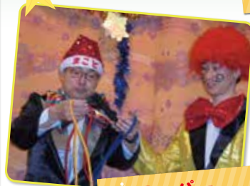
スーパーイリュージョン!