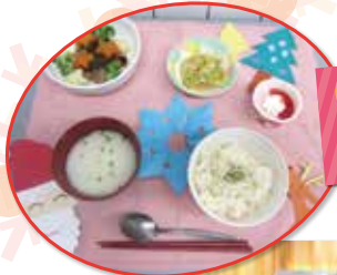
クリスマススペシャルランチ