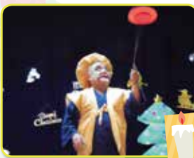
血が回っております!