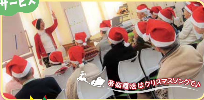
音楽療法はクリスマスソングで♪