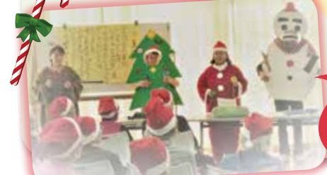
職員で 2曲 お披露目♪