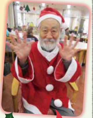
本物の サンタさん？

皆さまと楽しい年の瀬のひとときを過ごし、 来たる新年も笑顔あふれるデイサービスで ありますようお願いいたします。