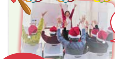
サンタ クロースと 仲間たち??!