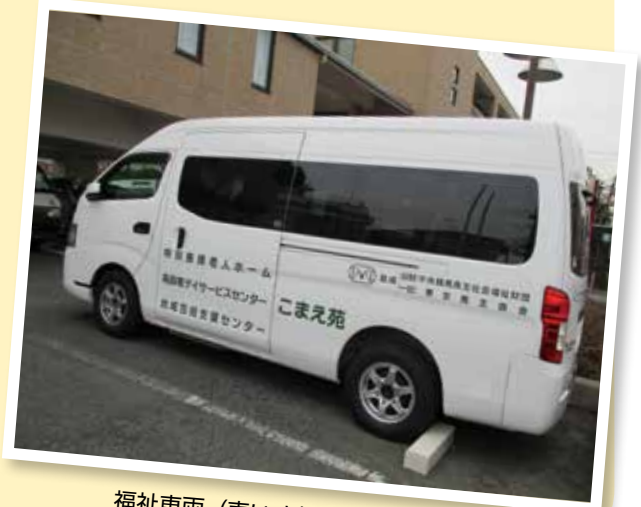
福祉車両（車いす対応車）

狛江を中心に元気いっぱい走っているのので、皆様にも顔を覚えていただけたらと思っております。