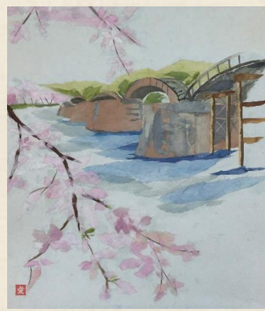
(ちぎり絵)製作:松坂 愛子様 「錦帯橋」