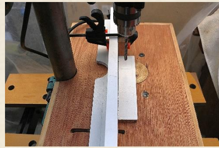
(卓上ドリル) 匿名「センター合わせ治具」 穴を開けたい箇所の中央にきりを合わせやすくする道具